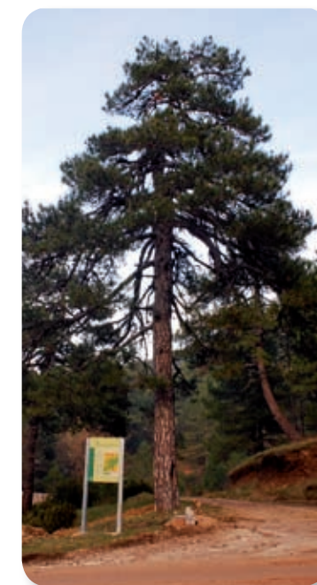
Pino salgareño en el cruce de caminos

Desde aquí vemos, a pocos metros un cruce de caminos [5]. El de la derecha nos llevaría, en unos diez kilómetros, hasta las cumbres de Peña Corva (1.559 m), y el Pardal (1.580 m). Nosotros continuamos por el ramal de la izquierda, hacia las cumbres del Blanquillo (1.830 m).