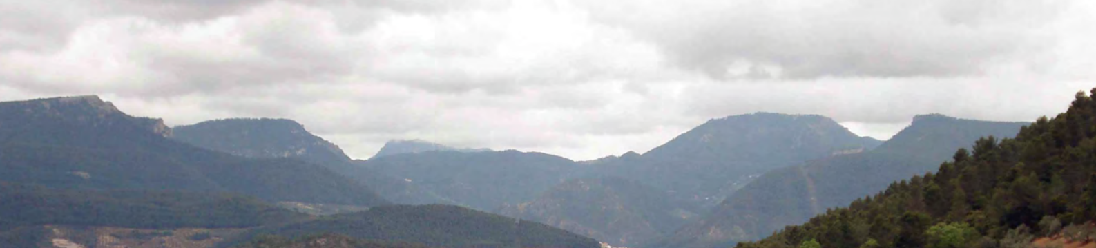
■ Peña del Cambrón